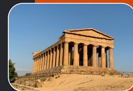
VALLE DEI TEMPI